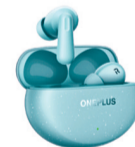
OnePlus Buds 3 Pro