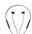
OnePlus Neckband ANC

BALODA BAZAR- RAJESH TIME CENTRE, 9826306306, RISHABH ELECTRONICS, 7000060620, SHRI SAI SALES, 9907942222, VALECHA MARKETING, 9300470924, BHATAPARA- BABUJI MOBILES, 9302298000, GALAXY MOBILE WORLD, 9827198278